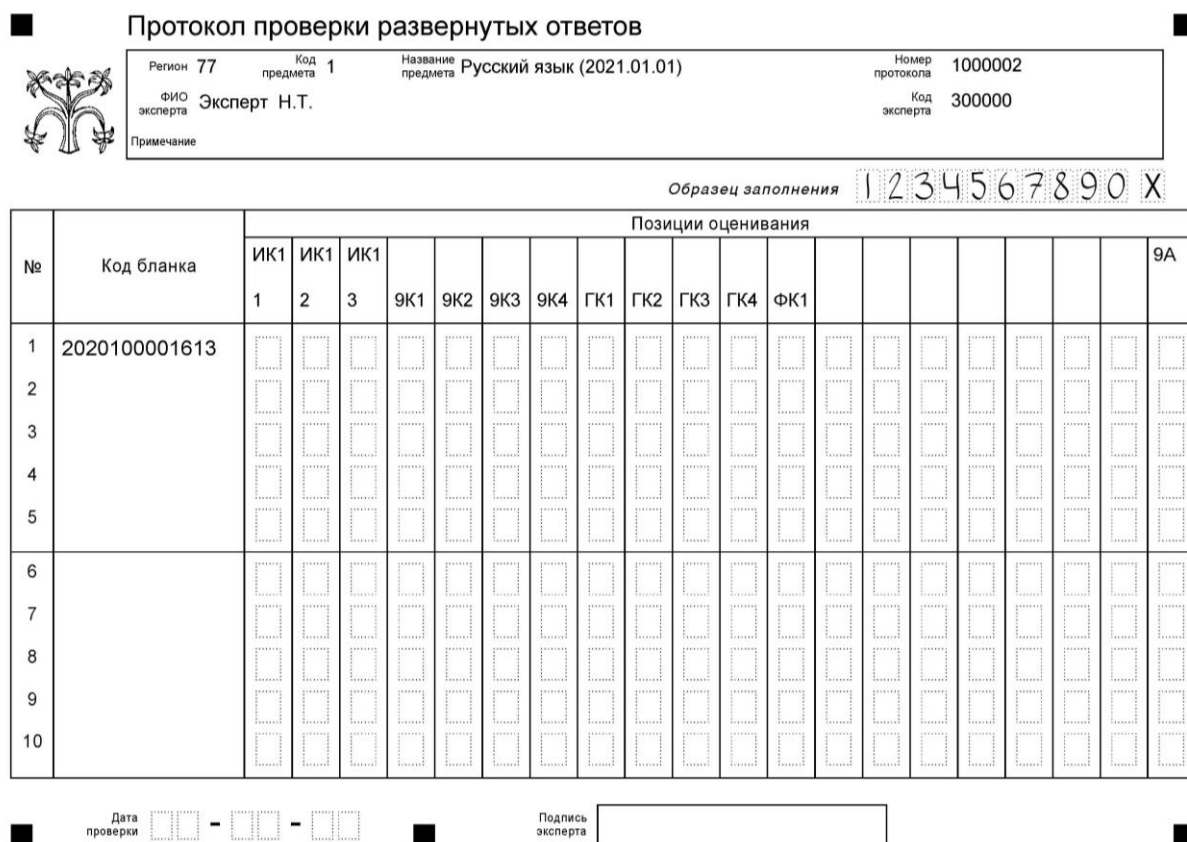
Рисунок 1. Вариант формата бланка протокола проверки развёрнутых ответов 4

Внимание! При выставлении баллов за выполнение задания в протокол проверки развёрнутых ответов следует иметь в виду, что если ответ отсутствует (нет никаких записей, свидетельствующих о том, что экзаменуемый приступал к выполнению задания), то в протокол проставляется «X», а не «0».